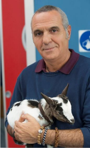
Walter - Giorgio Panariello

Torna in Italia dopo vent'anni di Africa alla scoperta che suo nipote è in realtà suo figlio. Grande cuore, istinto e poca razionalità cercherà coi suoi modi diretti e alle volte confusionari di creare un rapporto con la famiglia del suo defunto fratello e i tre nipoti che non ha mai davvero conosciuto. Amante degli animali, gestirà la clinica veterinaria del fratello assieme a vecchi amici ritrovati, una collega che è anche qualcosa di più e un socio col quale sarà scontro aperto dal primo incontro. Ma soprattutto il suo obiettivo sarà quello di trovare una chiave per il cuore di suo figlio.