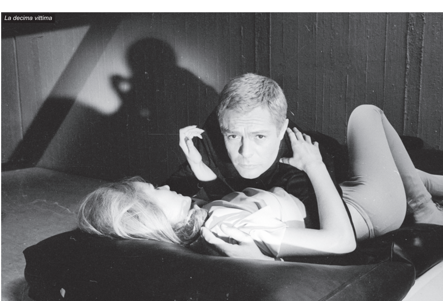
La decima vittima

ore 19.00 Pelle viva di Giuseppe Fina (1962, 115') Andrea è un operaio e ogni giorno per recarsi in fabbrica prende il treno. Conosce Rosaria, una ragazza madre meridionale del sud. Ben presto si sposano. Ma la vita non è facile. L'uomo, a causa di uno sciopero, si trova coinvolto in disordini. Interviene la polizia e Andrea viene tradotto in questura con altri dimostranti. Per questo subirà un processo. «Pelle viva, in poche parole, racconta la storia di uno di quei trecentomila operai che ogni