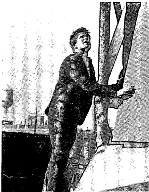
(A destra): Da Mickey One dell'americano Arthur Penn. (Warren Beatty).