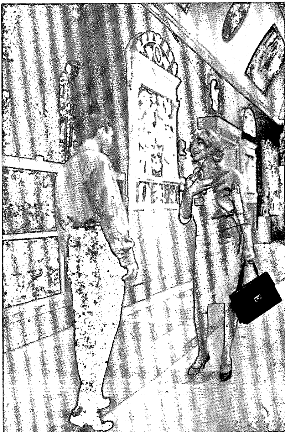
Da Ho vent'anni (t.1.) del sovietico Marlin Kutziev, film già conosciuto come La barriera di Il'ic e oggetto di vivaci polemiche in patria.