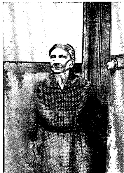
(A destra): Da La vieille dame indigne , opera prima del francese René Allio, ispirata a Brecht. ( Sylvie ).