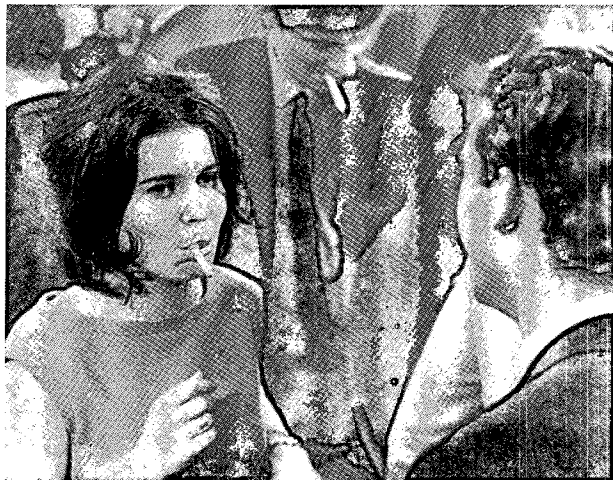
(A destra): Da Good Times, Wonderful Times dell'americano Lionel Rogosin, realizzato in Gran Bretagna. -