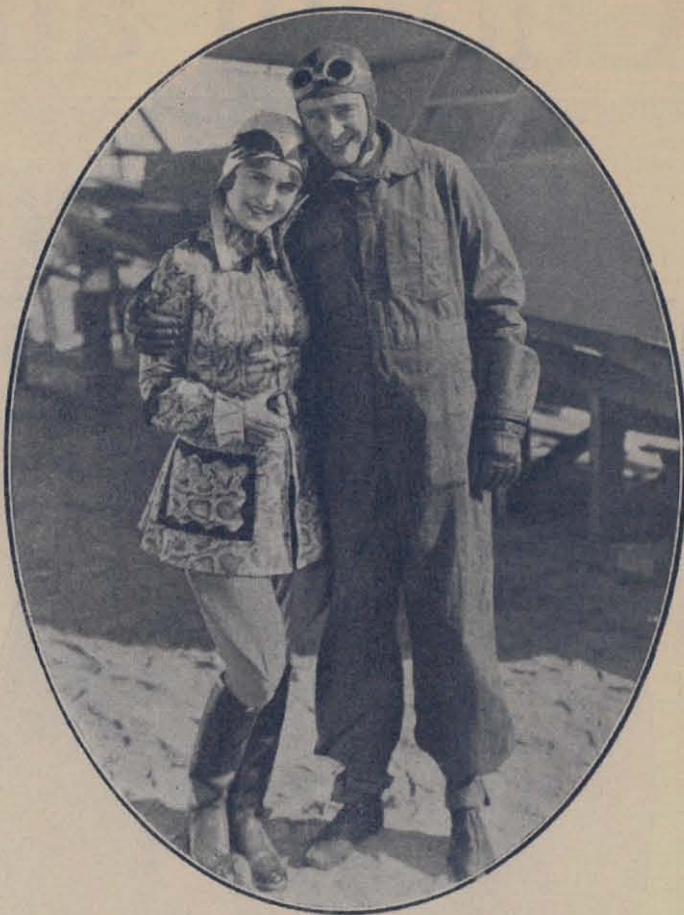
....Pronti : si parte....

l'impresa definitivamente fallire, ma una buona stella assiste i due ardimentosi i quali riescono a raggiungere la mèta lontana. Il trionfo è assicurato, il lavoro organizzato da Alberto ha dato i suoi buoni frutti e otterrà il suo premio: la mano di Violetta e il successo finanziario della ditta Elver.