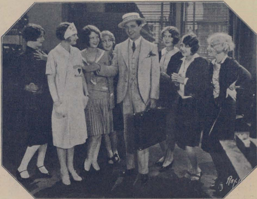
...LA BIONDA O LA BRUNA?... Questo è il problema !...