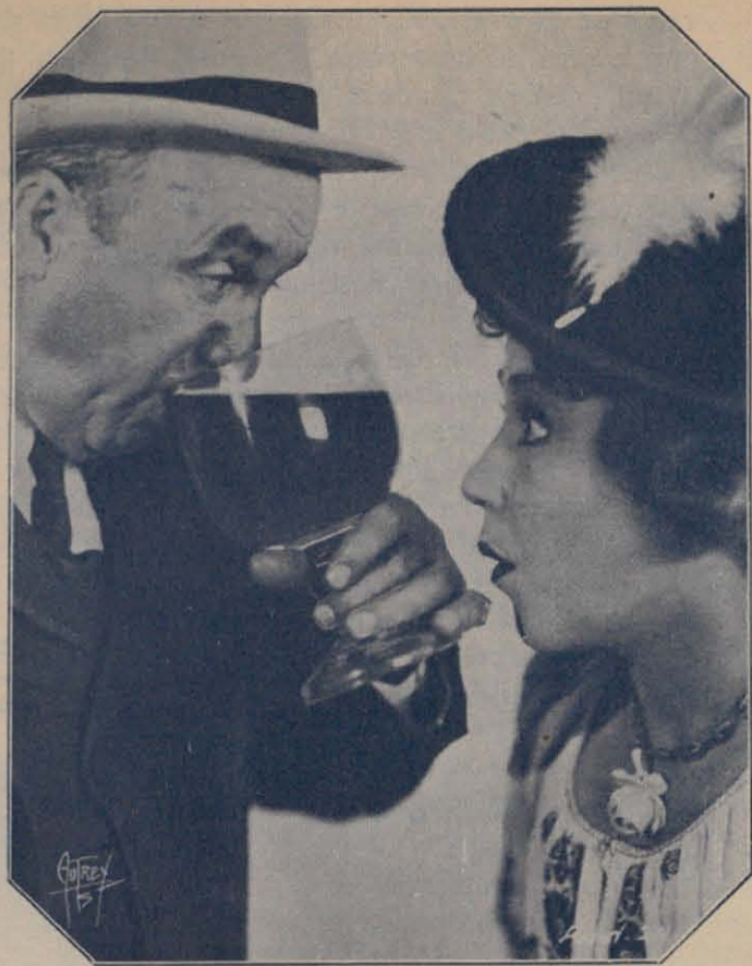
....CHE SETE AMOR MIO!.... (PARIGI, CHE CUCCAGNA 1 - FOX FILM)

che accade, fra i due mali, sceglie il migliore. Certa che se Riley rimanesse a Parigi sarebbe per lui totalmente perduto, si allea a Davide, arrestano Riley gli mettono le manette lo impacchettano e lo portano di forza a Le Havre e lo imbarcano.